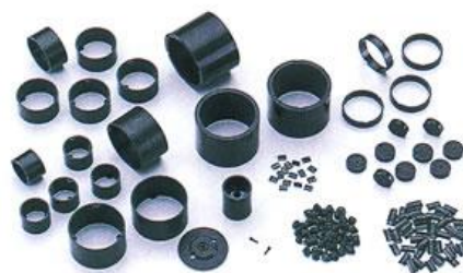
Daido Electronics Co., Ltd.