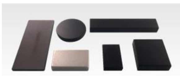
Daido Electronics Co., Ltd.