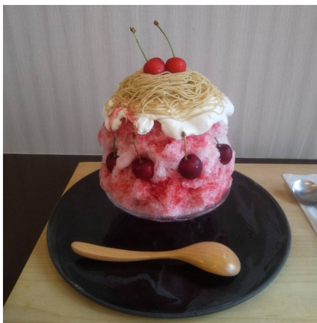
さくらんぼモンブランかき氷：1,450円(税込)

T&Sサクセス株式会社（本社：京都府京都市、代表：水野慎介）は京都市中京区に「栗座~和栗モンブラン専門店~」を、2022年8月25日（土）にリニューアルオープンいたします。リニューアルに際し、「さくらんぼモンブランかき氷」と「カップケーキモンブラン」の販売も開始いたします。（営業時間：11:00~20:00）