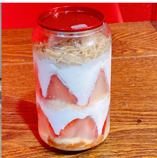
カップケーキモンブラン：950円(税込)

栗座は2020年11月にオープンした、和栗を使ったモンブランを上質な空間で堪能できる、和栗モンブラン専門店です。オープンからおよそ1年半、たくさんのお客様に和栗の魅力をお伝えしてまいりました。