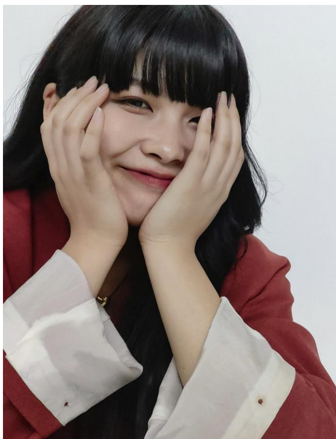
第2部 - OPPO 賞