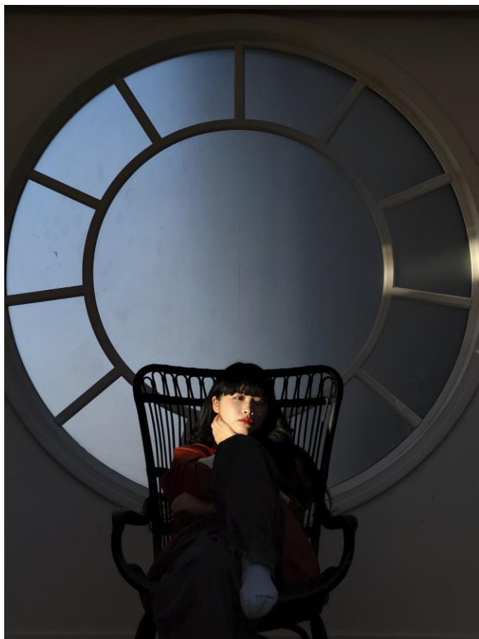
第1部 - OPPO 賞