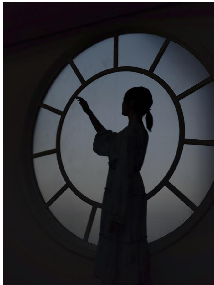
第2部 - コハラタケル賞