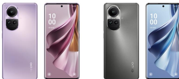
■ グロッシーパープル

※2…1000 回の充電を繰り返してもバッテリー容量は 88%以上を維持。これは OPPO Reno8 シリーズのデータに基づいてユーザーの日常行動（1日1回のフル充放電）をシミュレーションし、1600 回の充電を繰り返した後もバッテリー容量は 80%以上という結果に基づいています。1600 回は約 4 年間の使用に相当します。これは OPPO 実験室で収集されたデータに基づいています。テストソフトウェアのバージョンや特定のテスト環境により若干異なる場合があります。また、お客様の使用状況や使用環境によって異なります。