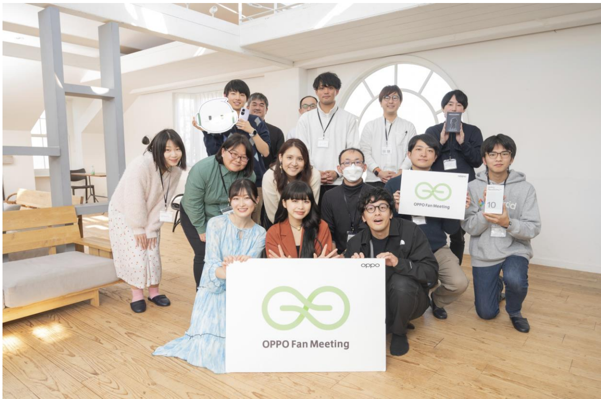
1 部（午前）にご参加くださったみなさんと記念撮影

革新的なデザインとテクノロジーで業界をリードするスマートデバイスブランド OPPO は、12 月 3 日（日）に第 4 回目となる OPPO ファンミーティングを開催しました。今回のファンミーティングでは 10 月に発売したミッドハイモデル、OPPO Reno10 Pro 5G の特長のひとつであるポートレートカメラとその性能にフォーカスし、普段からスマートフォンでよく写真を撮るという方を中心にご招待しました。ゲスト講師には写真家として活躍するコハラタケルさんを招き、カメラの基本的な知識から OPPO Reno10 Pro 5G を使ったポートレート撮影のポイントやテクニックに関するレクチャー、そしてコハラさんのアドバイスを受けながら参加者全員が実際に OPPO Reno10 Pro 5G でモデル撮影体験をし、その作品でミニフォトコンテストを行いました。OPPO Reno10 Pro 5G ユーザーの方も、そうでない方も、リラックスした雰囲気の中、OPPO Reno10 Pro 5G の優れたポートレートカメラや各種撮影モードについての理解を深めていただける充実した内容でした。