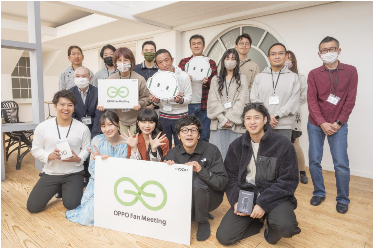
2部（午後）にご参加くださったみなさんで記念撮影

第4回目を迎えたOPPOファンミーティングは、都内のハウススタジオを会場に、初の午前と午後の2部制で実施しました。今回もたくさんのご応募をいただき、当日はどちらの回にも約15名程度、計30名ほどの参加者のみなさんをお迎えすることができました。入り口で受付を済ませた方からハウススタジオの2階に上がると、今年OPPOが日本で発売したOPPO Reno10 Pro 5G、OPPO Pad 2、OPPO Reno9 Aの3製品が参加者のみなさんをお出迎え。ファンミーティング開始までは参加者の方同士で話をしたり、各々ドリンクやお菓子で一息ついたりしていました。