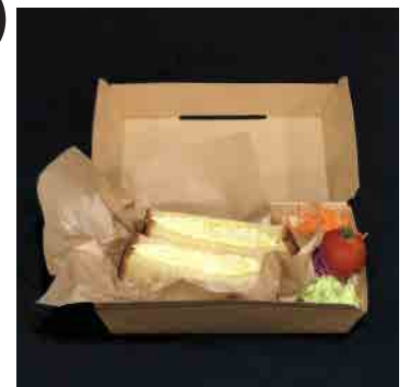
平飼いたまごサンドイッチBOX ¥650

くまさんポテトやたこさんウインナー、ナポリタンなど、お子様が食べやすいメニューをお勧めします。