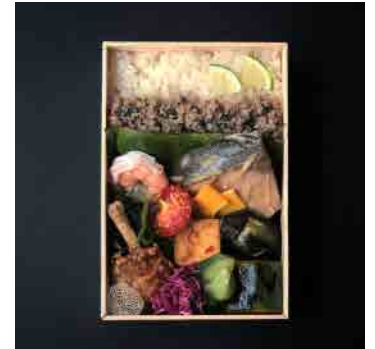
インドシナのハーブ弁当 ¥1,620

女性向けに野菜メインのお弁当です。調理法も蒸したり炊いたり、できるだけ油を使わず砂糖は不使用です。