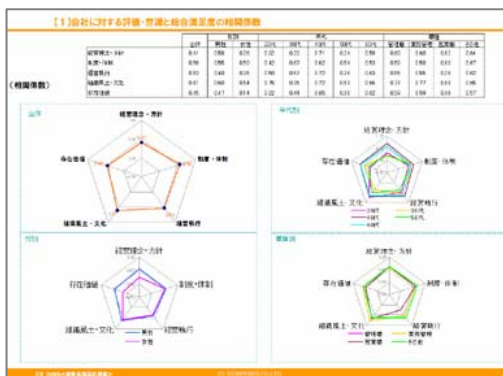
会社に対する評価・意識と 総合満足度の相関関係図

項目ごとに詳細にデータを集計・分析し、現状と問題点が一目で把握できるよう、直感的に分かりやすいレポートをご提供します。また、専門家のコメントにより、改善すべき点がわかります。