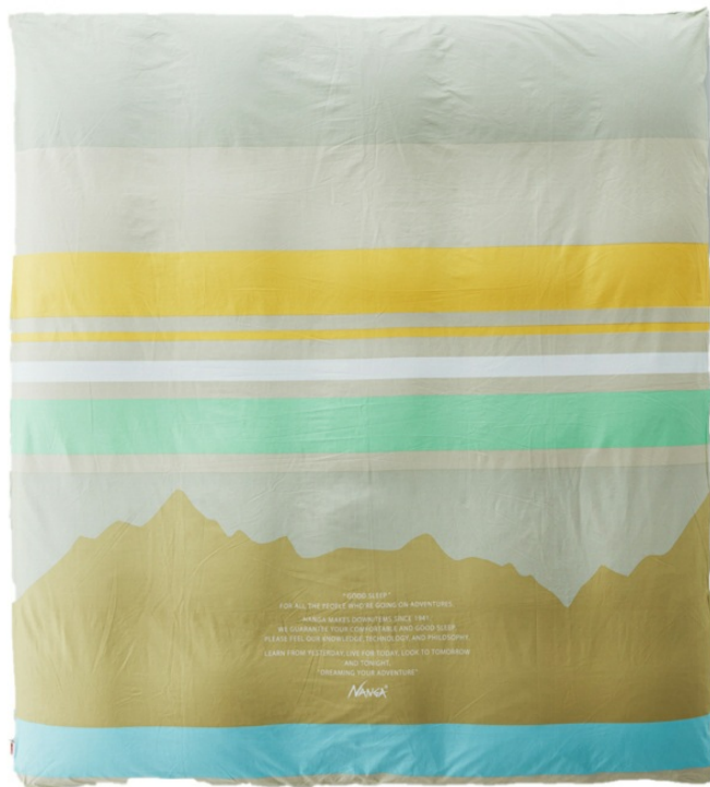
「 DUVET COVER NANGA MOUNTAIN DOUBLE (デュベカバー ナンガ マウンテン ダブル) 」