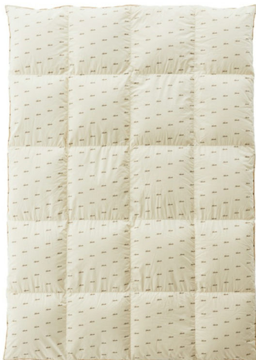
「DOWN DUVET SINGLE（ダウン デュベ シングル）」