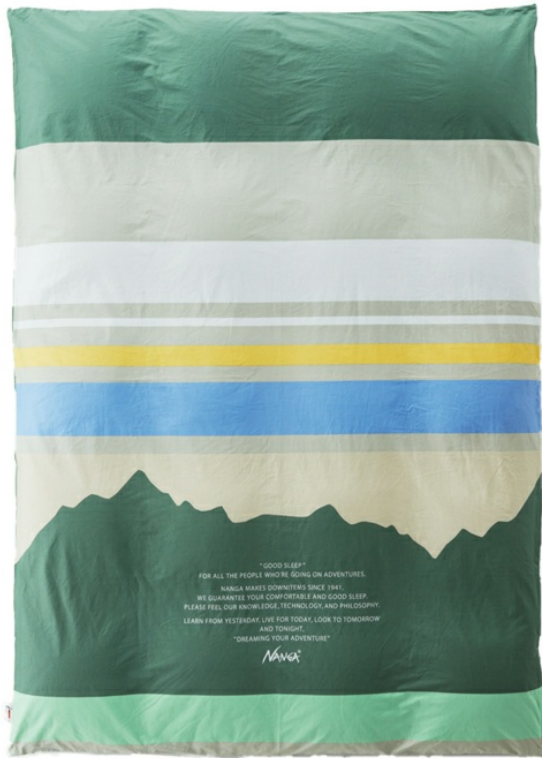
「 DUVET COVER NANGA MOUNTAIN SINGLE (デュベカバー ナンガ マウンテン シングル) 」