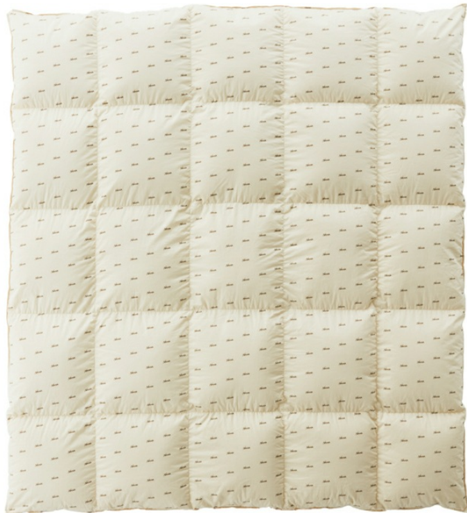
「DOWN DUVET DOUBLE (ダウン デュベ ダブル)」