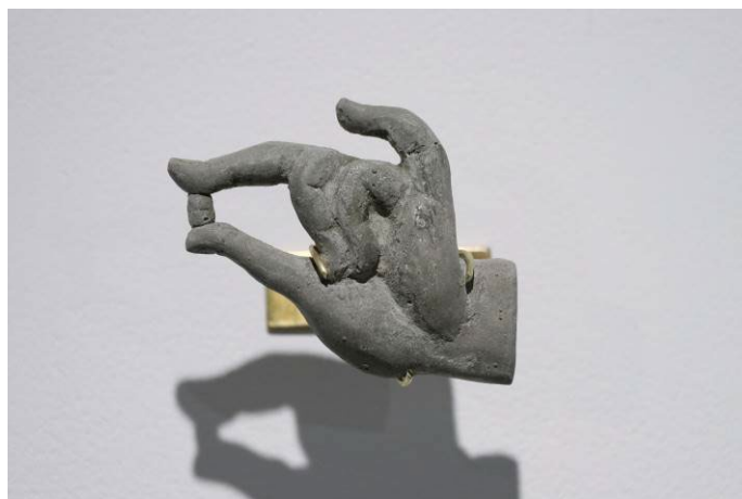
右：「Street Amulets - Hand / ストリートアミュレット 手」2022年 60×70mm セメント、真鍮