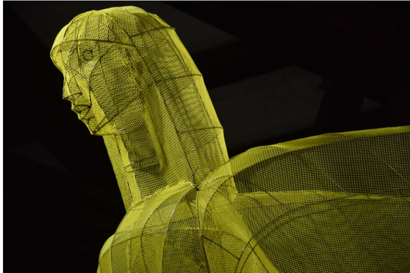
「Steel framed Goddess」 2024年 180×172×74 cm 鉄、防風ネット

ポーラ ミュージアム アネックス(東京・中央区銀座)では、久保寛子の展覧会「鉄骨のゴッデス」を2024年4月26日(金) から6月9日(日) まで開催します。