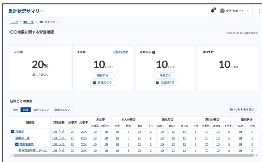
パソコンでの安否集計画面