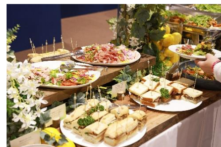
▲「ホスピタリティプログラム」のサービス。左から座席でのドリンクサービス、お土産イメージ、専用ラウンジでのbuffetイメージ