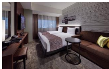
快適性を重視した客室