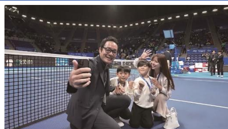
▲抽選で当たるオンコート記念撮影イメージ

※コイントス、エスコートキッズの抽選は、8月31日(日)までに購入された方が対象です。