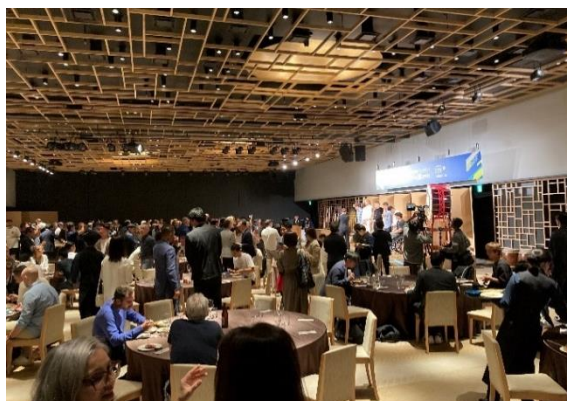
▲過去開催のレセプションパーティー様子