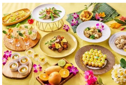
和洋中ブッフェが揃うレストラン