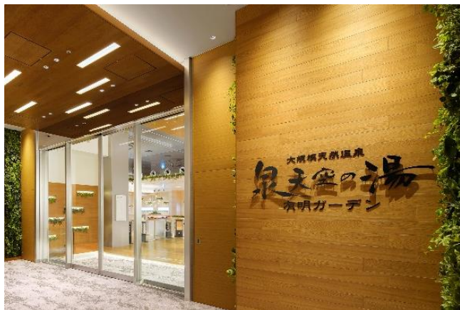
泉天空の湯 有明ガーデン 入口

https://www.shopping-sumitomo-rd.com/ariake/spa-izumi/