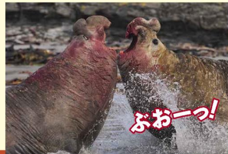
ミナミシウアサラシ(→68ページ)は、ハレムをつくるために オスどうして たたかいます。

むれの ボスを きめたり、メスに もてたりするために オスどうして きそいあいます。