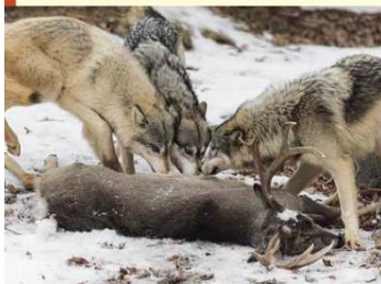
ハイイロオオカミ(→24ページ)は、むれでえものを かこんで つかまえます。