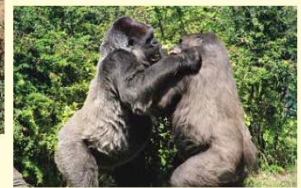
かぞくを、まもるため、ほかの オスと たたかう ヒガシゴリラ(→28ページ)。