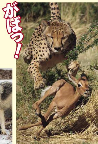
チーター(→20ページ)は、すばやい あしをいかして えものを おいかけます。

たべものになる どうぶつをつかまえます。いっぴきでかりをする いきものも、みんなで きょうりよくする いきものも います。