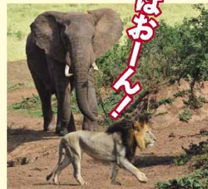
アラリカウ(→28ページ)は、こどもを ねらうライオンを おいはらう ことも あります。