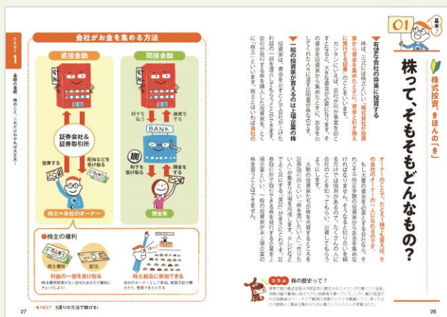
※『いちばんカンタン! 株の超入門書 改訂4版』