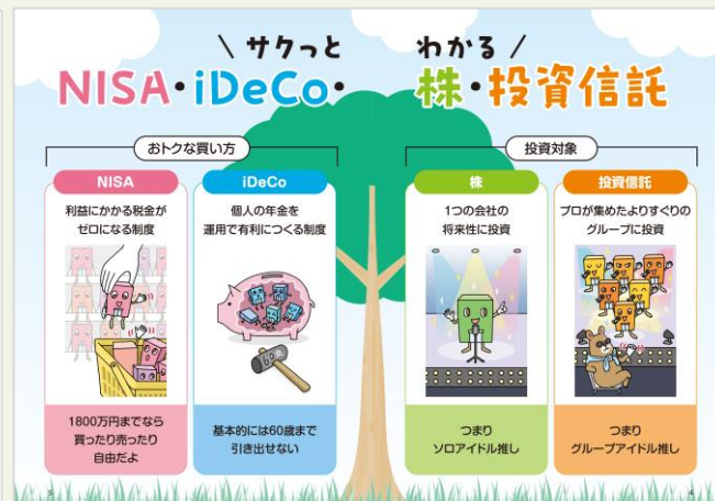
※『いちばんカンタン! 投資信託の超入門書 改訂版』