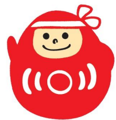
▲「就活も高橋」キャラクター きまるくん

「就活しなきゃ…でも何をすればいいかわからない」という学生の情報源としても最適です。