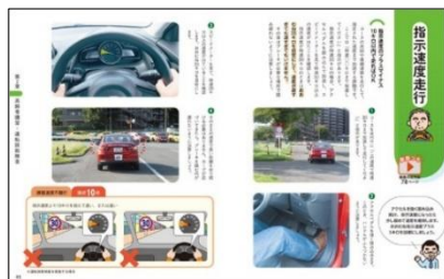
動画でわかる！ 実車指導・運転技能検査のポイント解説