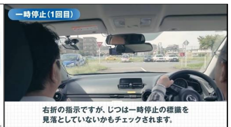
一時停止(1回目) 右折の指示ですが、じつは一時停止の標識を見落としていないかもチェックされます。