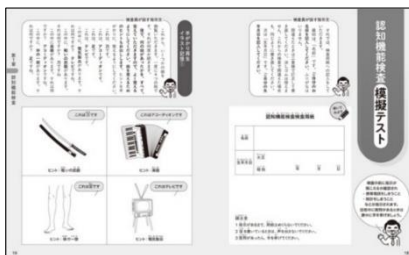
本番そっくり！ 認知機能検査模擬テスト