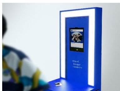
フォトカード撮影ブース