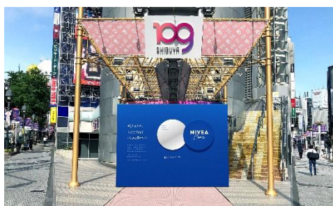
巨大ニベア缶モチーフのフォトスポット

撮影したフォトカードに、ステッカーやカラーペンを使い、自分らしくデコレーションいただけます。七夕に願いをのせて、好きな人へのメッセージや、好きな自分を表現した個性あふれるフォトカードを飾っていただけるスペースもございます。