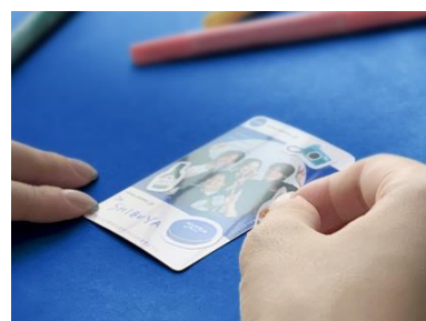
デコレーションスペース