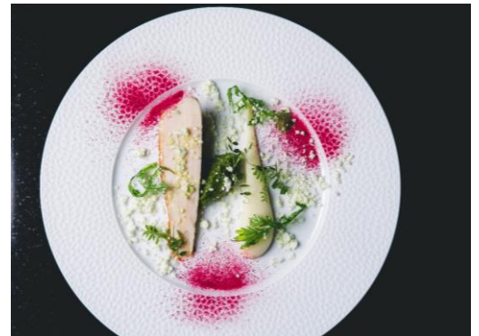
京都丹波産鶏胸肉のヴァブール 桜葉ペーストとマッシュポテト