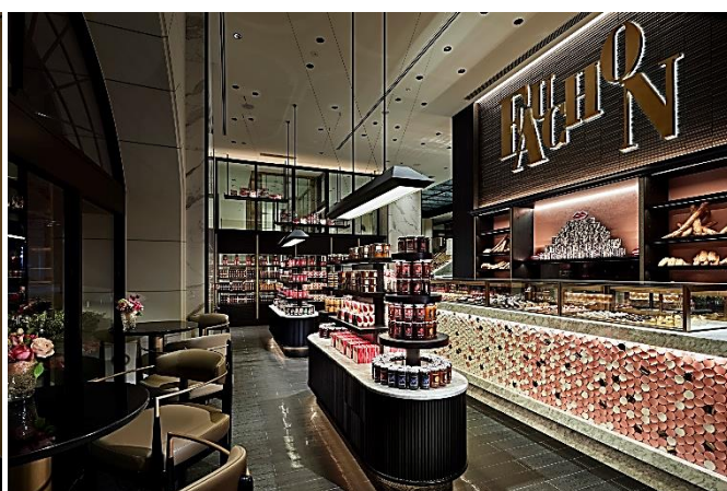
「Pâtisserie & Boutique Fauchon」店内

ファッションホスピタリティとして日本初・世界で2軒目となる「ファッションホテル京都」（所在地：京都府京都市下京区 総支配人：大石博史）が、2021年3月16日（火）に開業いたしました。