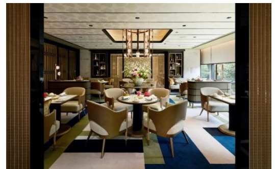
「Salon de Thé Fauchon」 / 店内