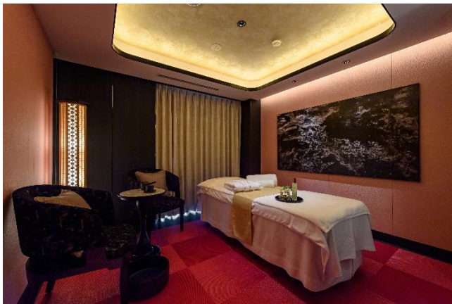
「Le Spa Fauchon」 / 店内