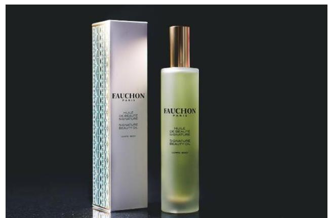
ファッションホテル京都オリジナルオイル

3階の「Le Spa Fauchon (ル スパ ファッション)」は、ファッションブランドとして世界初出店となるスパ。国内外のラグジュアリーホテルでスパを手掛ける業界最大手、株式会社クレドインターナショナルが運営を行います。プロダクトやメニューの開発・監修は、パリで数々の5つ星ホテルスパやアメニティを手掛け、今回日本初上陸となるプレミアムコスメブランド「KOS PARIS (コスパリ)」と、株式会社クレドインターナショナルが共同で行います。「希少価値の高い植物の効果を