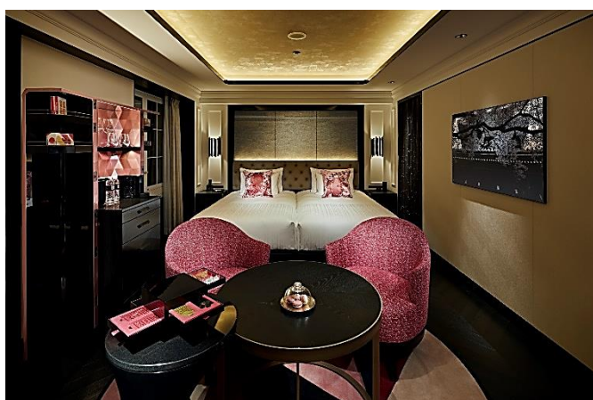
「スーペリアルーム」