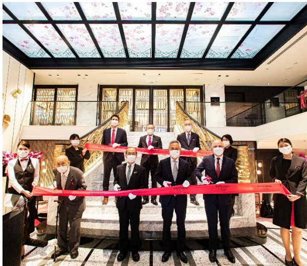
「テープカットセレモニーの様子」

本日は「ファッションホテル京都」の開業セレモニーにお越しいただき、誠にありがとうございます。 まずは、本日の開業まで多大なるご尽力を賜りました関係者の皆さまとホテルスタッフに、深く御礼申し上げます。 また、本日は大変お忙しい中、多くの皆様のご臨席を得ましたこと、心より厚く御礼申し上げます。 当ホテルのコンセプトは、「FAUCHON Meets Kyoto. Feel Paris.」です。京都の街を大いに楽しんで頂いたあと、このホテルに帰ると「パリを味わえる」「ファッションを味わえる」というまったく新しい滞在をしていただけます。京都の街は、実はパリと沢山の共通点があります。例えば鴨川とセーヌ川、教会と神社仏閣、紅茶や茶道、フランス料理と京料理など。このようなたくさんの共通点を、ホテルのホスピタリティやデザインに込めました。ぜひ、唯一無二のホテルを体感いただければ幸いです。 最後になりますがご臨席いただきました皆さまのご健勝とご発展を祈念するとともに、皆さまの温かいご支援とご協力を賜りますようお願い申し上げます。以上、関係者を代表致しまして 開業のご挨拶とさせていただきます。 本日はありがとうございました。