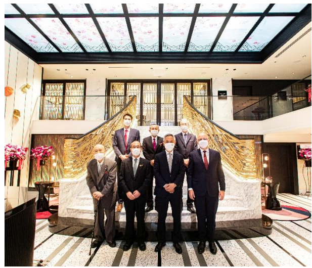
「フォトセッションの様子」