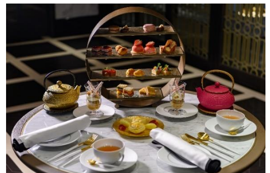
アフタヌーンティー