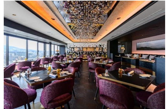
「Restaurant Grand Café Fauchon」 / 店内