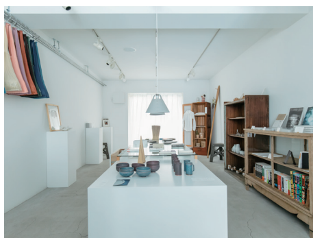
Community Store TO SEE

「アート」「デザイン」「工芸」などさまざまな分野のゲストをお招きし、オンライントークイベントを開催します。