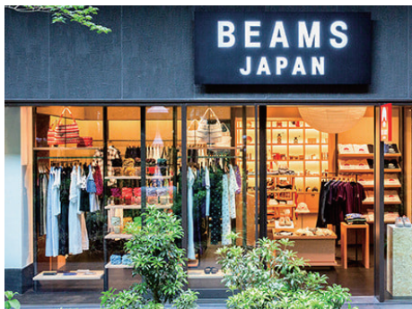
ビームス ジャパン 京都