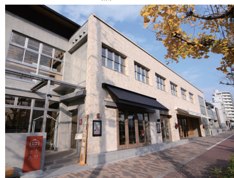
堀川新文化ビルディング

Community Store TO SEE に関わりのある作家やブランドなどを集めた合同展として開催している「Circle」。今回は兵庫県を拠点とする2つのブランド『le fleuve』と『SENREI』をポップアップスタイルでご紹介します。