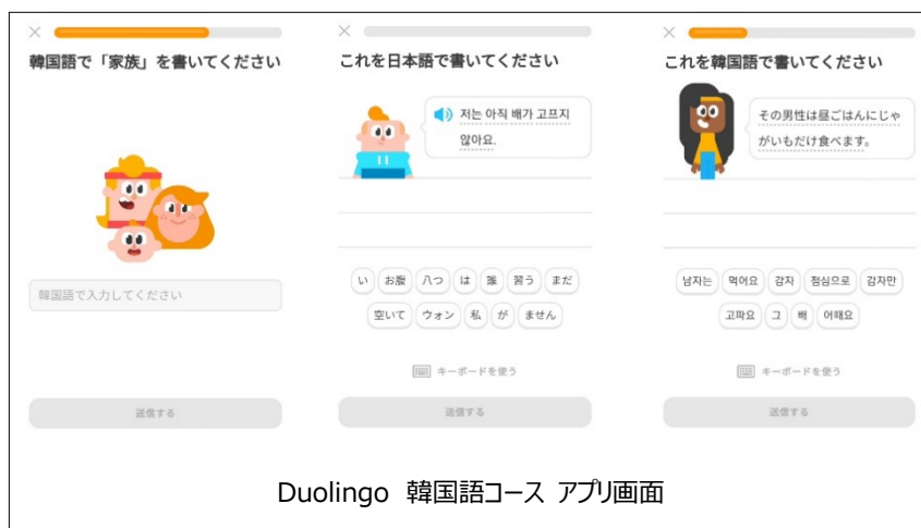
Duolingo 韓国語コース アプリ画面

※Duolingo Language Report(2020 年 12 月 15 日発表) http://blog.duolingo.com/global-language-report-2020