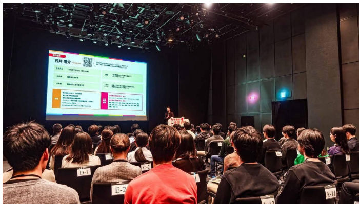
自社単独説明会の様子