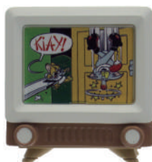
「ソフビジョン」 ¥1,600 (税別)