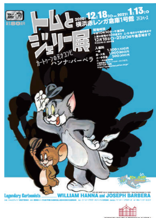
トムとジェリー展ポスタービジュアル

※画像データ使用の際は、キャプションと以下のコピーライト等の記載をお願いします。