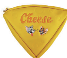
「チーズポーチトム & ジェリー」 「折りたたみエコバッグトム & ジェリー」 ¥2,900 (税別)