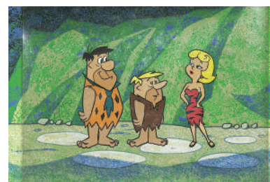
「原始家族フリントストーン」セル・セットアップ

低予算で毎週テレビ用アニメを制作する必要から、ハンナとバーベラが生み出したリミテッド・アニメーションの手法とともに、日本での馴染みが深いテレビシリーズを、懐かしい映像や音楽とともに、ご紹介いたします。 『スクービー・ドゥー』、『チキチキマシン猛レース』、『原始家族フリントストーン』ほか。