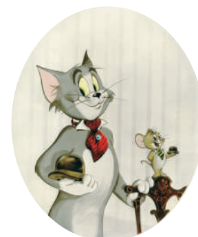
スパイクコレクション