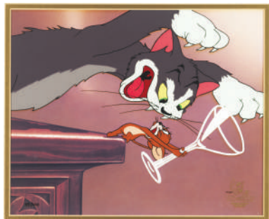
「上には上がある」セル・セットアップ