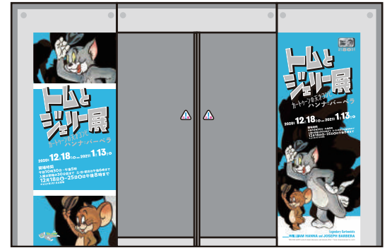
トム & ジェリーデザイン エントランス装飾（イメージ）