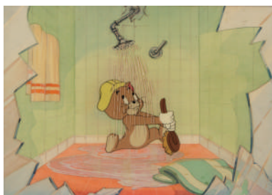
「やんちゃな生徒」セル・セットアップ