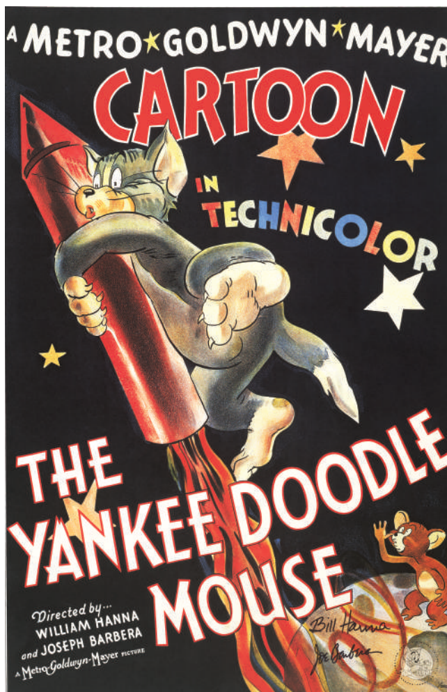
「勝利は我がに」ポスター・アート