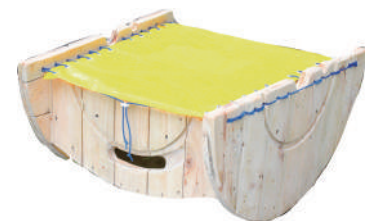
展示作品“小舟となり、ゆらゆらと” ※同作品3点を設置予定

TOM AND JERRY and related characters and elements © & ™ Turner Entertainment Co. (s20)