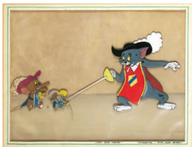
「武士道修行も楽じゃない」セル・セットアップ