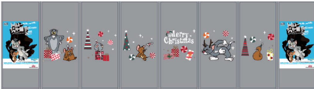
クリスマスデザイン ガラスボックス装飾（イメージ）