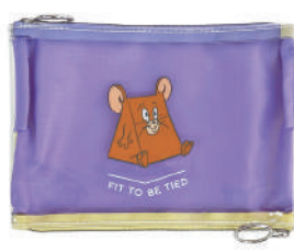
「マスクポーチ ジェリー」 ¥2,300 (税別)