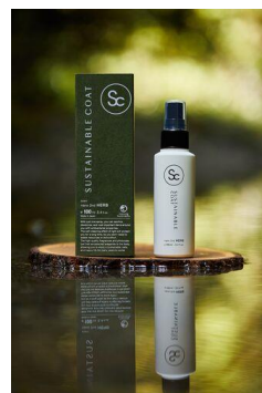
-nano 2nd HERB-