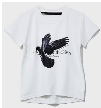
muller of yoshiokubo

「CS ケーススタディ」(メンズ) 「スタイル&エディット」(レディス) 「CSケーススタディキッズ」(キッズ)