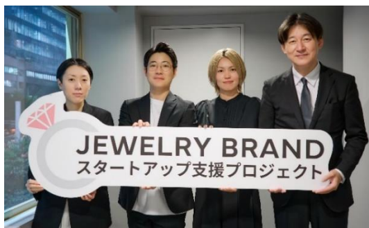
左から) 高島屋バイヤー、ラッキーアンドカンパニー商品開発担当者(2名)、阪急うめだ本店 婦人服飾品ゼネラルマネージャー

このたび、約100件の応募の中から審査の結果、6名のブランド開発メンバーが決定しましたのでお知らせいたします。今夏に向けて、ブランドの立ち上げや商品開発、店舗でのポップアップ展開、ECサイトでの販売を目指してまいります。