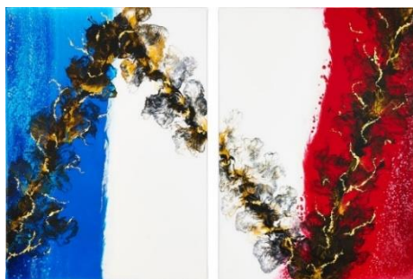
「ナポレオンの炎」(P8+P8号)