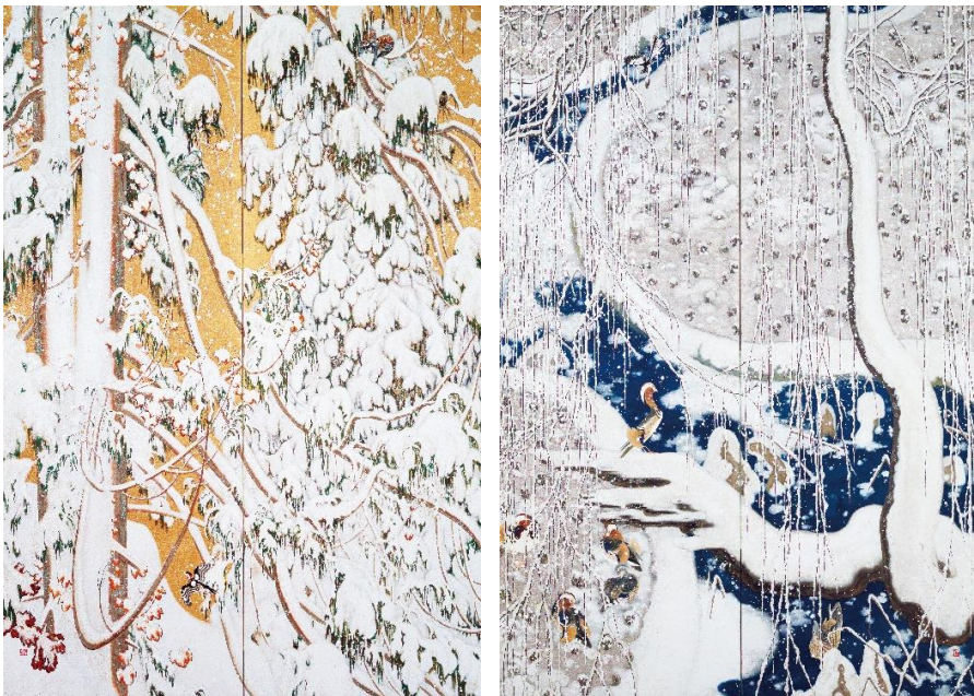
《雪》 大正9年（1920） 第2回帝展