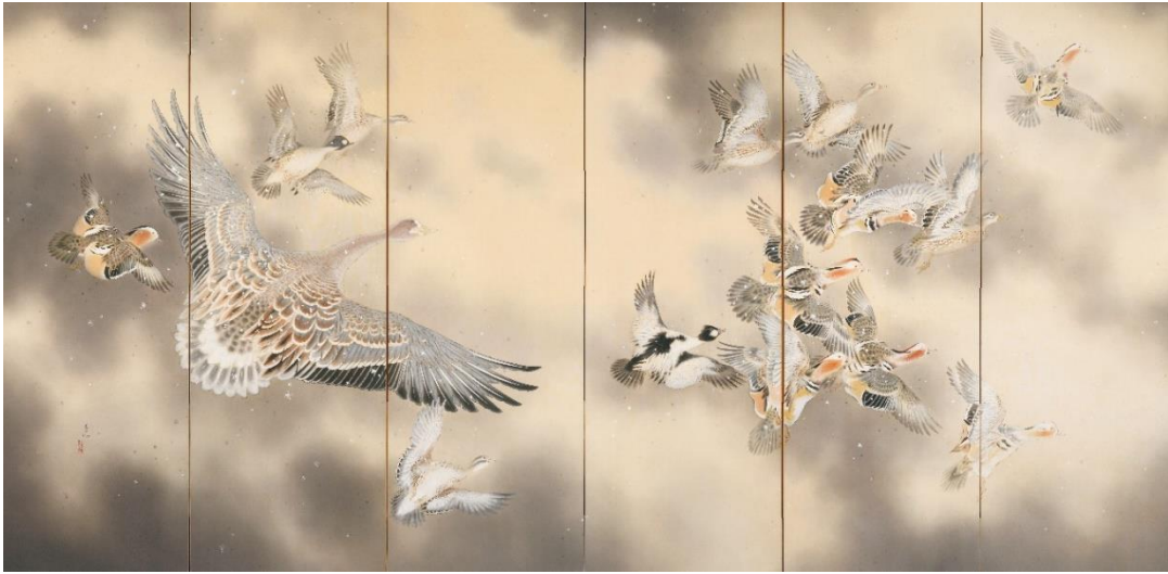
《隆冬》 昭和15年(1940) 紀元2600年奉祝美術展