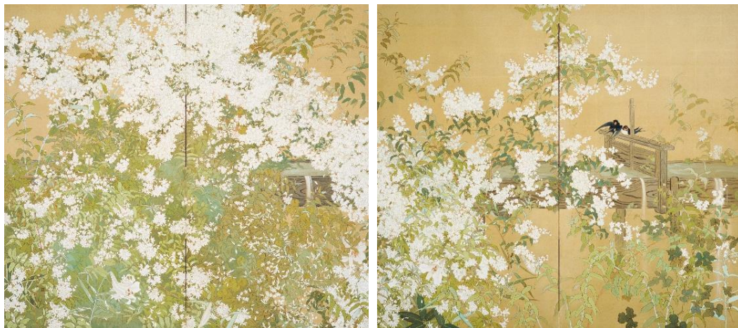
《笥》(かけい) 大正3年(1914) 第8回文展(褒状)