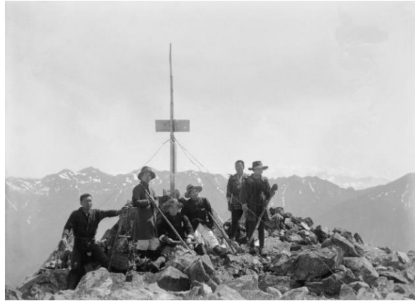
左：《白山の霊華》 明治43年(1910)頃