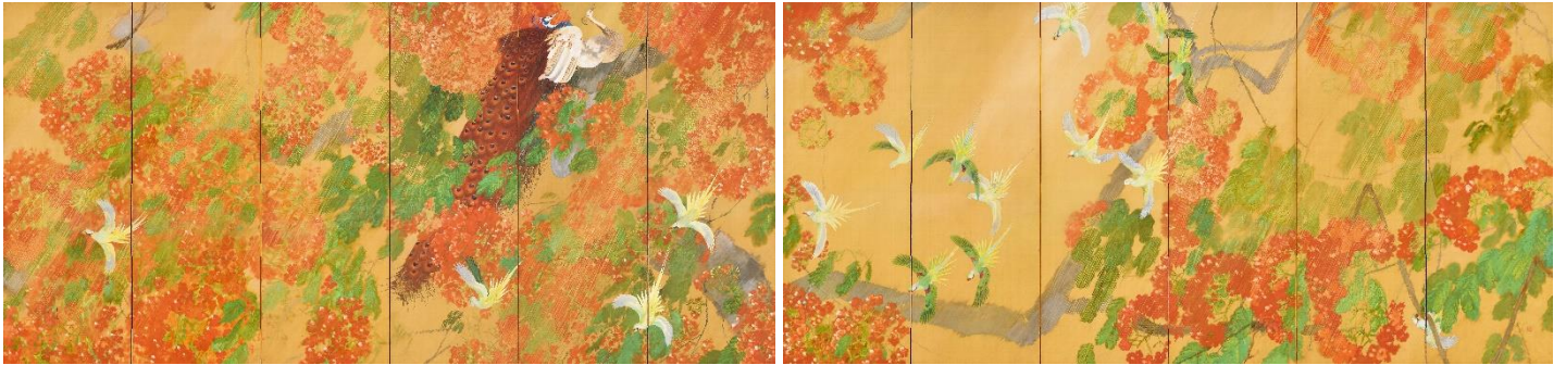
《燦雨》（さんう） 大正8年（1919） 第1回帝展（特選）

折しも、友人の土田麦僊らが国画創作協会を創立した大正7年（1918）、光瑤は国展には参加せず、インド旅行の成果として《熱国妍春》（京都国立近代美術館蔵）を第12回文展に発表し、特選を受けます。さらに翌年の第1回帝展には《燦雨》を発表し、官展で2年連続して特選を受賞、近代京都画壇にその地位を確立します。それらの濃密で豊潤な新しい花鳥画は、若き上村松篁にも大きな影響を与えたことでも知られます。