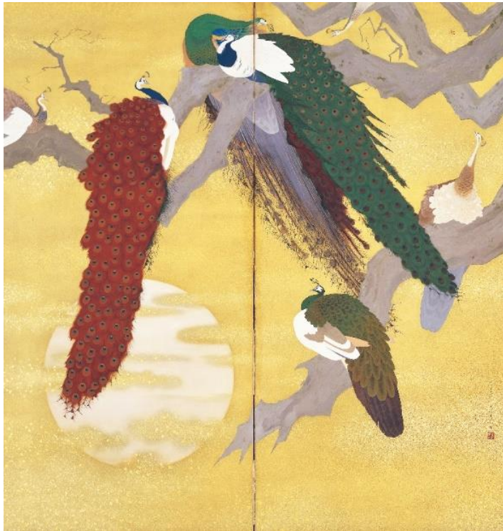
《寂光》(じゃっこう) 昭和4年(1929) 第10回帝展