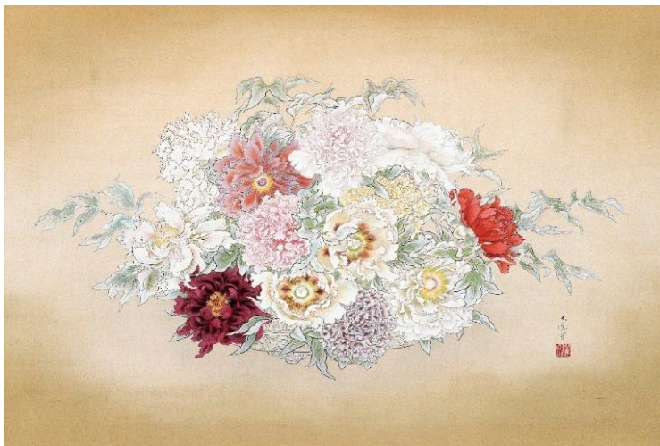
《聚芳》(しゅうほう) 昭和19年(1944)

「隆冬」とは真冬のこと。鳥の一群が、雪がちらつく曇り空を飛んで行きます。丹念に描かれた羽毛や雪の描写に写生の成果が見られます。前方をオシドリなどカモの仲間が乱れ飛び、その後ろから雁が悠然と羽を広げて迫る姿は、巧みな遠近法や様々な角度で描き分けられています。1羽の雁で重点を作り配列のバランスを取った構図も見事で、鑑賞する人に鳥と一緒に飛んでいるような印象を与える作品です。