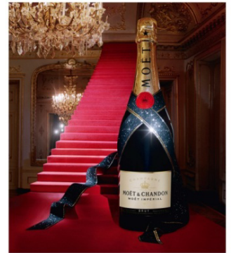
MOËT & CHANDON CHAMPAGNE

※右画像:このビジュアルは、フォトグラファーのTIM WALKER氏がシネマのシャンパンとしてのモエを象徴的に撮影したものです。