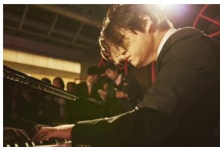
先鋭的な音楽を生み出し続けるピアニスト 渋谷慶一郎氏によるピアノ演奏