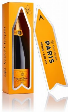
ヴーヴ・クリコ イエローラベル アロー マグネット 7,050 円(税別)

※全6都市(TOKYO,LONDON,PARIS,NEW YORK, MILAN,SYDNEY)のデザイン