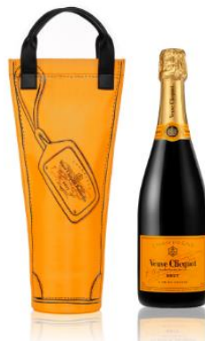
ヴーヴ・クリコ イエローラベル ショッピングバッグ 2017 7,150 円(税別)

※全6都市(TOKYO,LONDON,PARIS,NEW YORK, MILAN,SYDNEY)のデザイン