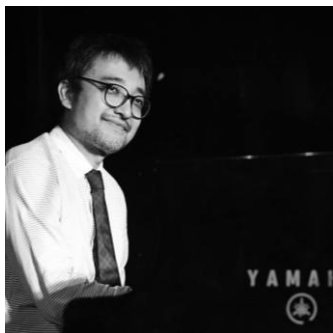
Tadataka Unno

Tadataka Unno オフィシャルサイト http://www.tadatakaunno.com