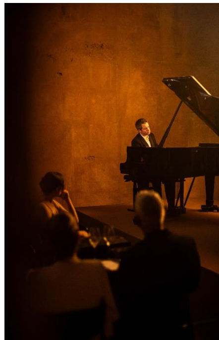
ベルトラン・シャマユ氏のピアノ演奏