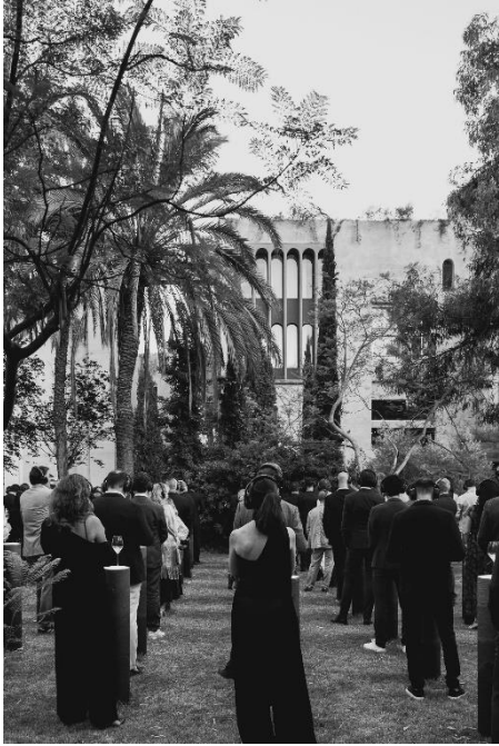
ソロテイスティング風景