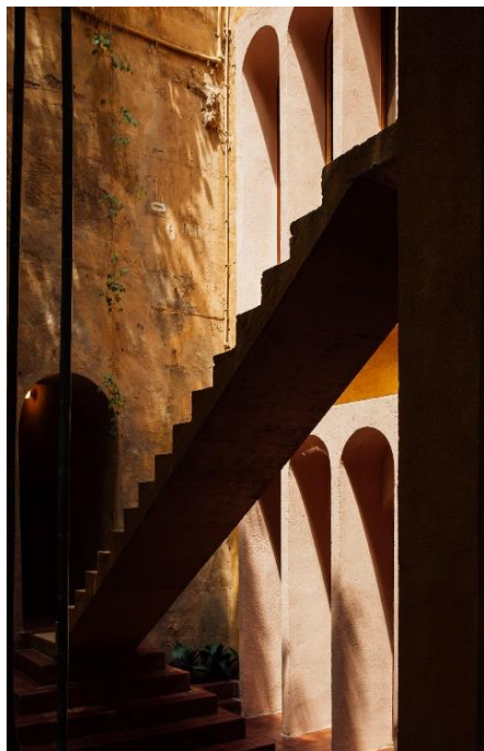
会場となった「ラ・ファブリカ」の建築

ディナーはアメリカ出身の作曲家ジョン・ケージが手がけた実験的でコンセプチュアルな3曲の、フランス人ピアニストのベルトラン・シャマユによる生演奏からスタート。楽曲の中で重要な役割を果たす静寂さは、新しいドン ペリニヨンのヴィンテージをより深く、そして内省的に堪能するために非常に効果的でした。