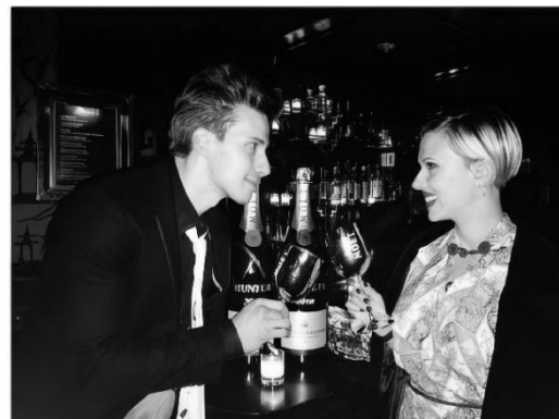
女優のスカーレット・ヨハンソンと双子の弟ハンター