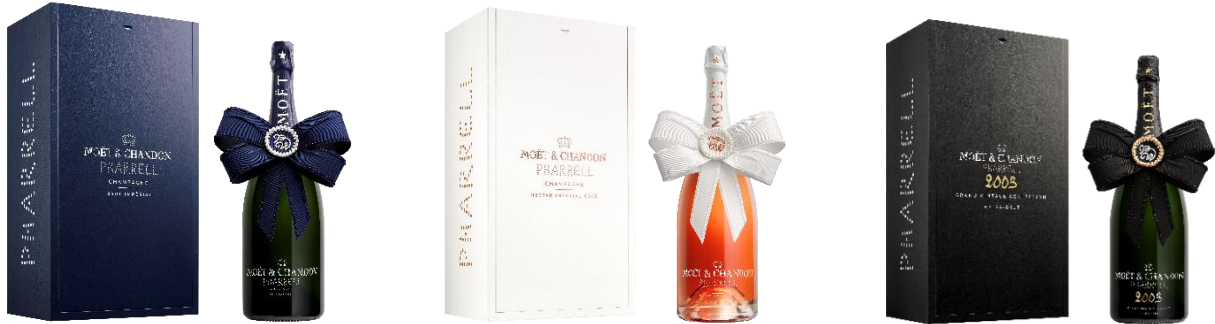
モエ・エ・シャンドン モエ アンペリアル ファレル ウィリアムス リボン エディション

価格：94,600 円（税別） / 104,060 円（税込） 容量：1,500ml（マグナムボトル）