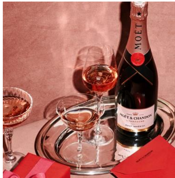
(左)『プラダを着た悪魔2』映画ポスター (右) モエ・エ・シャンドン ロゼ アンペリアル

MHD モエ ヘネシー ディアジオ株式会社（東京都千代田区神田神保町）の取扱いブランドであるシャンパン メゾン モエ・エ・シャンドンは、映画『プラダを着た悪魔2』の5月1日（金）日本公開を記念し、東急歌舞伎町タワー内のプレミアム映画館「109シネマズプレミアム新宿」（東京都・新宿区）との特別企画として、プレゼントキャンペーンを実施いたします。