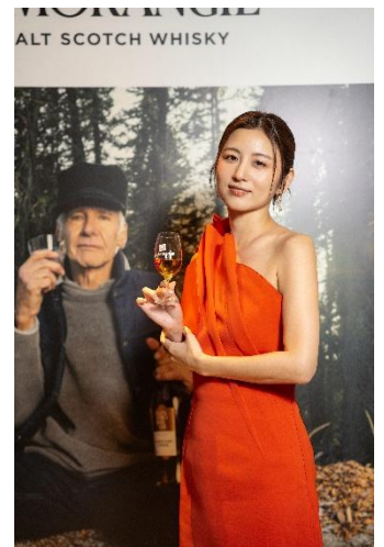
「グレンモーレンジィ ハリソン・フォード リミテッドエディション」 限定品ローンチイベントの様子