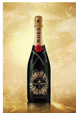
2016年ホリデーシーズン 限定パッケージ 「モエ・エ・シャンドン モエ アンペリアル ハナビ」

モエ・エ・シャンドン モエ アンペリアルが今年ホリデーシーズンにお贈りするの、ゴールドの輝きで夜空を美しく彩る大輪の“HANABI”をモチーフにした限定パッケージ。誰もが心躍る季節にふさわしい、打ちあがる花火の壮大さと優美さを表現した特別なデザインです。