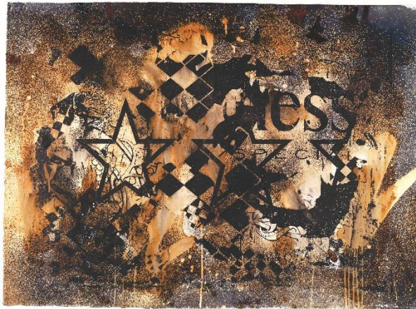
<ボックスデザイン>