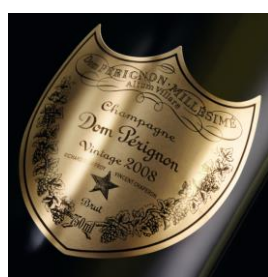
リシャル・ジェフロワと ヴァンサン・シャブロン の2人の名前を冠したゴールド カラーのスペシャルラベル