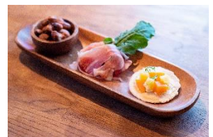
おつまみアソート 5コイン / 1,000円