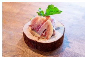
生ハムと無花果のスペシャル 3コイン / 600円