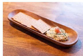
タラバガニの北欧風タルタル 4コイン / 800円