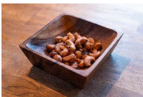
スパイシーカシューナッツ 2コイン / 400円