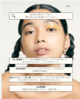
① 4つの肌タイプの中から当てはまるものを選択。