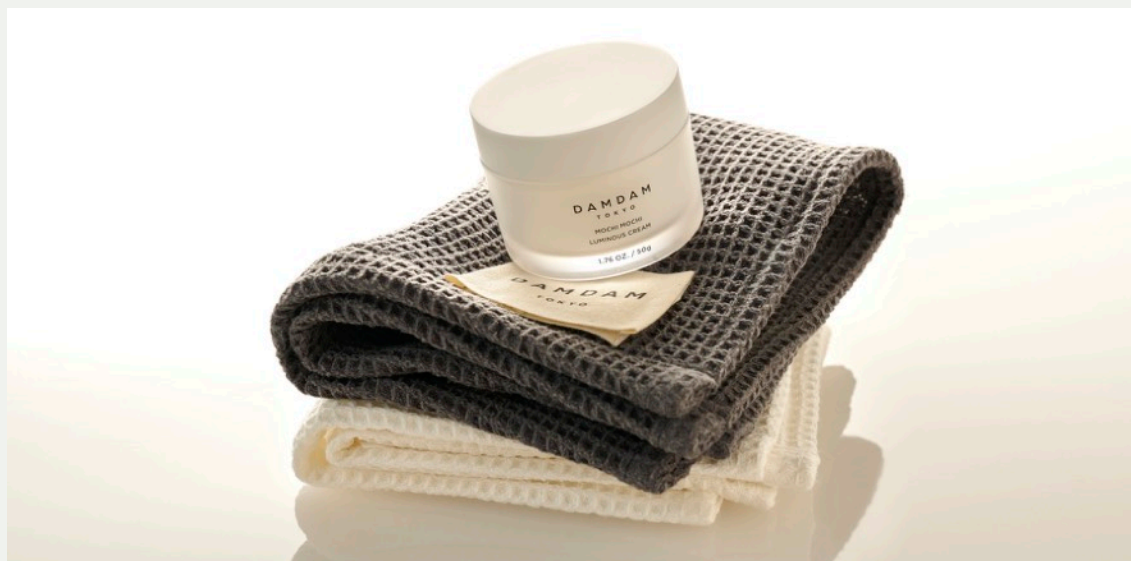
和紙タオル グレー ¥1,650