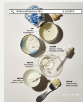
④ 最適なスキンケアプロダクトをよそった小鉢を懐石盆に並べてご提供。