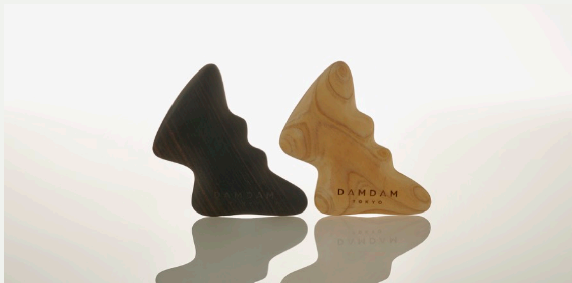
左) カッサ「TAKO（黒檀）」 ¥5,720、右) カッサ「TAKO（ヒノキ）」 ¥5,060