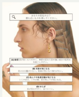
② 4つの肌悩みの中から当てはまるものを選択。