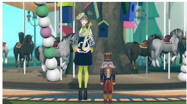
「白玉響ふわり」3D モデル

「DIG SHIBUYA」は、国内外から、テクノロジーとアートを掛け合わせた表現に取り組む多様なクリエイターが集結し、渋谷の街を舞台に、大型インスタレーションやデジタルアート上映、音楽フェス、ワークショップなど、30 以上の多彩なプログラムを展開するイベントです。