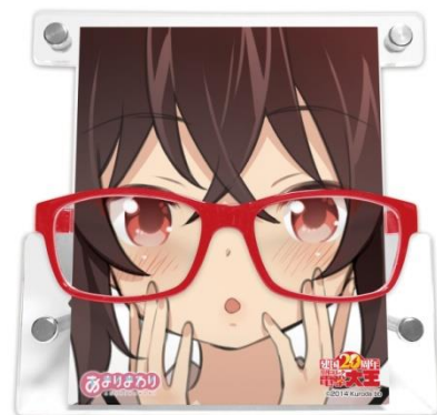
↑ 電撃大王建国20周年 グラススタンド[ガールズ]