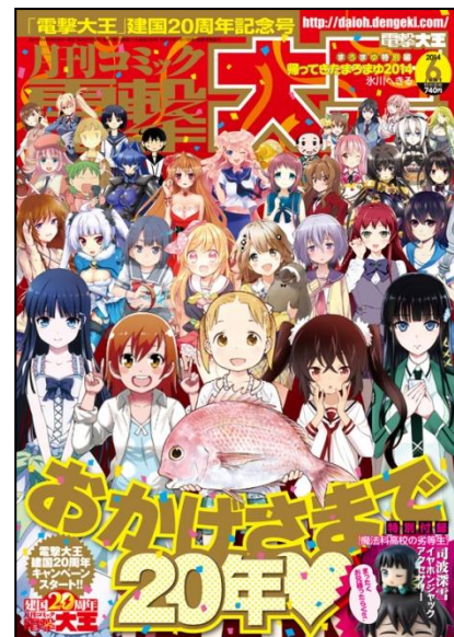
↑「月刊コミック電撃大王」 2014年6月号(4/26発売)表紙

すべてのコンテンツファンに贈る、最強コミックマガジン「月刊コミック電撃大王」20周年にご注目ください。