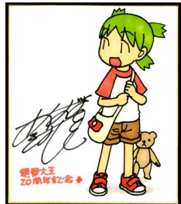
↑ A賞: 作家サイン入りイラスト色紙イメージ