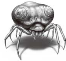
鳥のフンに化けるクモ？