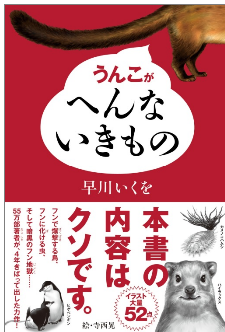
↑ 『うんこがへんないきもの』表紙

【書名】 うんこがへんないきもの 【著者】 早川いくを 【イラスト】 寺西 晃 【判型】 四六判 【ページ数】 242ページ 【定価】 本体1,430円＋税 【ISBN】 978-4-04-886442-8 【発行】 株式会社KADOKAWA 【プロデュース】 アスキー・メディアワークス 【書店発売日】 2014年12月5日（金）