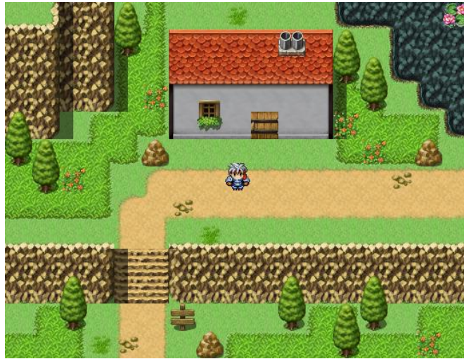
▲前作 VX Ace

また原則として、前作の画像を縦横1.5倍した内容となり、アニメーションや表現の幅が大きく広がり、多くのプレイ環境に対応いたしました。