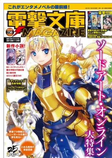
「電撃文庫MAGAZINE」11月号 表紙

11月号には、『ソードアート・オンライン アリシゼーション』『青春ブタ野郎はバニーガール先輩の夢を見ない』『とある魔術の禁書目録Ⅲ』のアニメ3タイトルの見所を総力特集した小冊子「電撃文庫 2018年 秋アニメ最強ガイド！」と「ゲーム三国志大戦「馬姫」アイテムコード」の特別豪華2大付録がつけます。