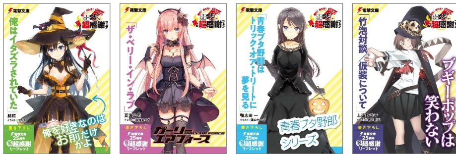
↑ リーフレットイメージ

電撃文庫の人気キャラクターが毎月テーマごとの衣装で登場。10月のテーマは「ハロウィン」です。