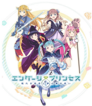
イラスト／かんざきひろ

電撃文庫とniconicoがタッグを組み、原作・メインストーリーを伏見つかさが、メインキャラクターデザイン・イラストをかんざきひろが担当するラブコメRPG『エンゲージプリンセス』が、事前登録キャンペーンを実施中です。公式サイトでは、『エンゲージプリンセス』メインビジュアルに加え、作品のストーリーや5名のメインキャラクターの詳細・担当声優を公開。第2弾となるPVもご覧いただけます。