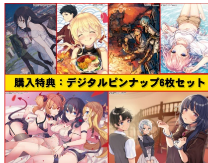
ピンナップイラスト集イメージ (画像は Vol.62 のものです)

※電子版と紙版で発売日が異なります。電子版は偶数月25日ごろ配信予定となります。