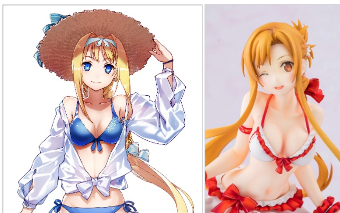
左:『ソードアート・オンライン』アリス モチーフイラスト (イラスト/abec)

さらに、電撃文庫25周年プレミアムグッズとして『狼と香辛料』のホロとロレンスの結婚式を祝うカップ＆ソーサーのペアセット、ドラムメーカー「カノウプス」とのコラボによるスペシャルドラマセットの予約を開始いたしました。今後も、さまざまな記念グッズを企画してまいります。