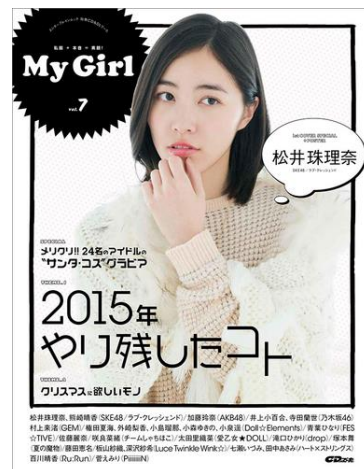
“面推し”ガールズビジュアルブック My Girl