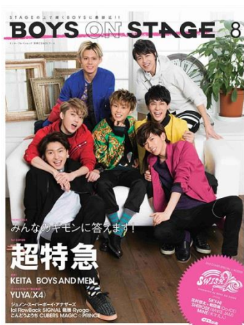
ダンス&ボーカルボーイズグループ専門誌 BOYS ON STAGE