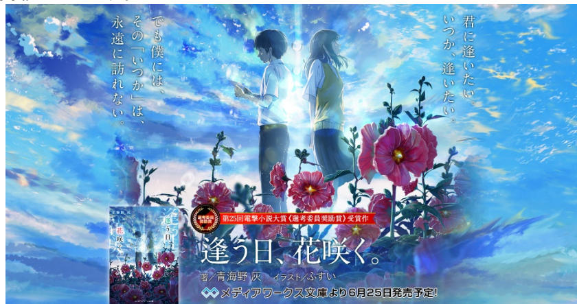
「第25回電撃小説大賞」受賞作特集サイトイメージ

「第25回電撃小説大賞」受賞作の魅力をお伝えするための特集サイトでは、各作品のストーリーや登場人物紹介、試し読みなどを掲載しています。