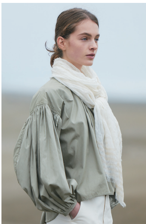
No.55910080-B ¥10,000+税 約55cm×185cm 麻綿毛カシミア ストール