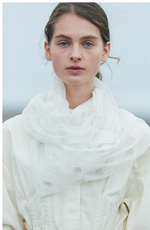
No.55910079-C ¥10,000+税 約35cm×180cm シルク綿毛カシミアバックカット ストール