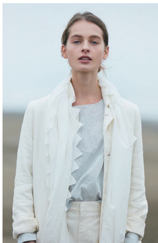
No.55915014-C ¥15,000+税 約50cm×170cm シルク綿刺繍 ストール