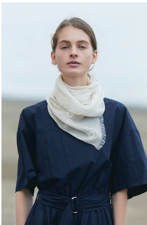
No.55910078-B ¥10,000+税 約35cm×160cm シルク麻綿毛カシミア刺繍入り ストール