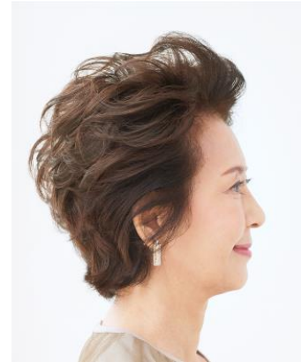
後頭部の丸みもキープ！

手触りの自然さや耐熱力にもこだわった新毛髪「エアファイバー」を採用。 ご自宅のヘアアイロンなどでスタイリングしたヘアスタイルも、これまで以上にキープ力がUPしました。