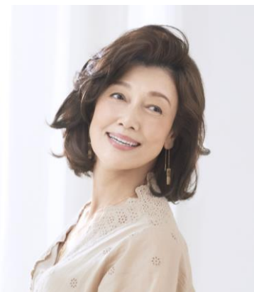
レフィア カレン LL