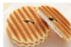
鼓月 千寿せんべい