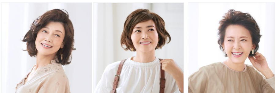
レフィア カレン LL

レフィア カレン: https://www.julliaolger.jp/brand/lefiacuren/