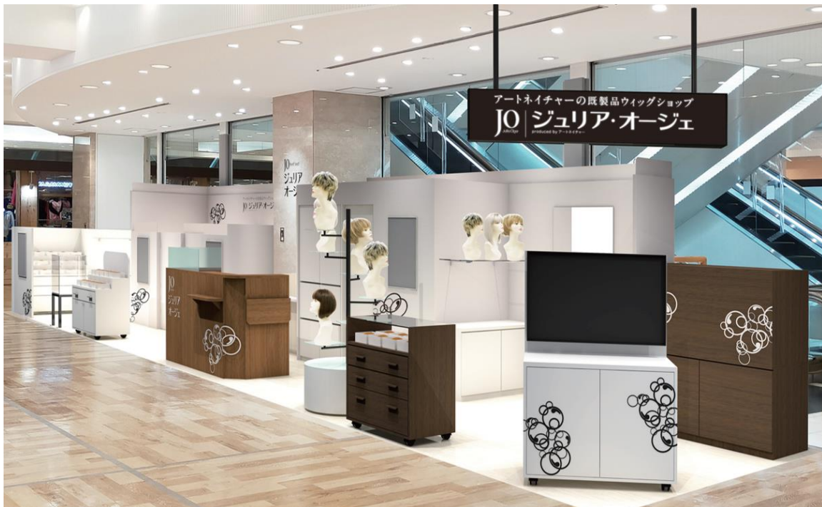
ウィッグショップ

毛髪に関する総合サービスを提供する株式会社アートネイチャー(本社:東京都渋谷区 代表取締役会長兼社長:五十嵐祥剛)は、2022年3月18日(金)、ウィッグショップ「ジュリア・オージェ ダイナシティウエスト店」(神奈川県小田原市)を、ダイナシティウエスト内のファッションや雑貨を扱う2Fに移転リニューアルオープンいたします。