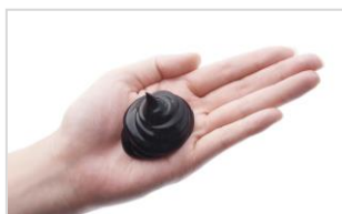
ピンポン玉大 目安