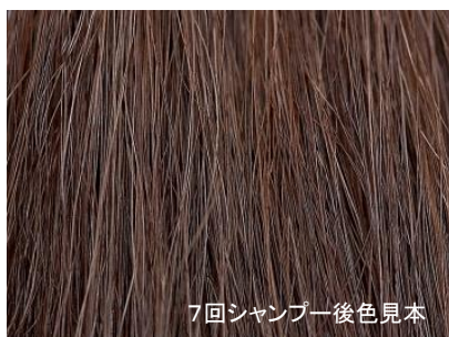
7回シャンプー後色見本